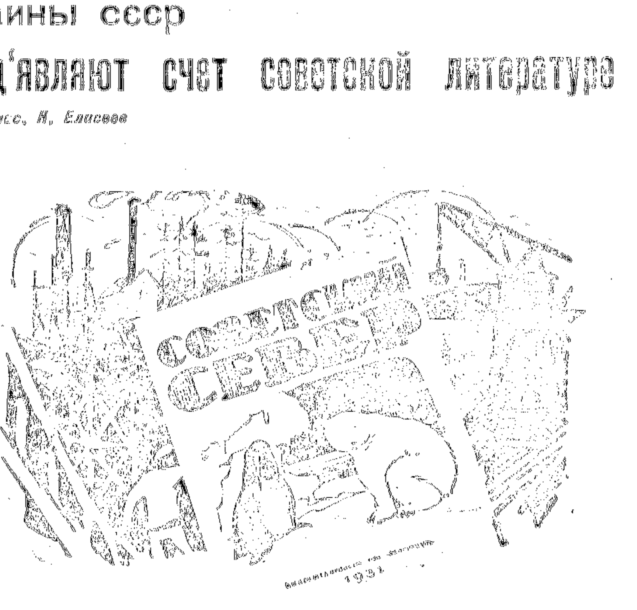
как раскрывают север советские писатели